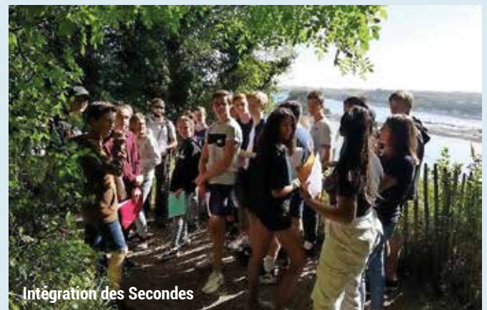
Intégration des Secondes