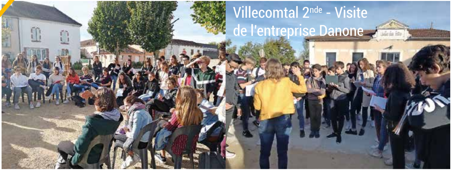
Villecomtal 2 nd e - Visite de l'entreprise Danone