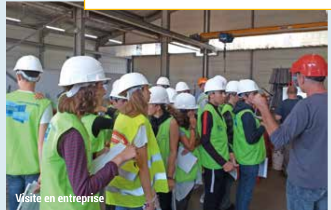
Visite en entreprise